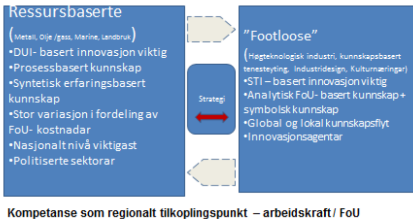
Figur 2- Ulikt kunnskapsbehov

Framveksten av eit meir kunnskapsintensivt næringsliv inneber meir spesialisering. Dei fleste bedrifter og organisasjonar har behov for å innhente komplementære ressursar utanfrå i gjennomføringa av eigne innovasjonsprosessar. Dei som lykkast klarer å utnytte den kunnskapsflyten og dialogen som finn stad mellom krevjande kundar og bedriftene, med å utvikle og utnytte den spissa kunnskapen og dialogen med kunnskapsmiljøa. Nettverk og relasjonar mellom aktørar - være seg mellom bedrifter og næringer, eller med utdannings- og FOU-miljø, er vesentleg både for utvikling av tillit og spreiding av kunnskap. Slik kontakt og samarbeid med andre utviklar gjerne evna til å reflektere og lære av både eigne og andre sine strategiar og handlingar. Det er såleis viktig med sosiale og institusjonelle nettverk knytt både opp mot marknaden, mot leverandørane og dessutan mot andre produsentar anten dette er konkurrentar eller andre når omstilling og nyskaping finn stad.